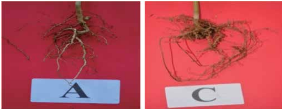
Gambar 2 Nodul akar kayu angšana (A = kontrol, C = menggunakan mikoriza)