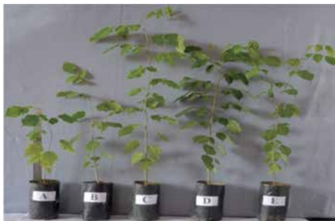
Gambar 1 Pertumbuhan kayu angsana [A = kontrol, B = G. halonatum , C = C. etunicatum , D = Glomus sp dan E = Campuran (B+C+D)].